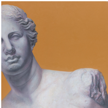
藤田勇哉 「YF923」 油彩・綿布 91.0×91.0cm